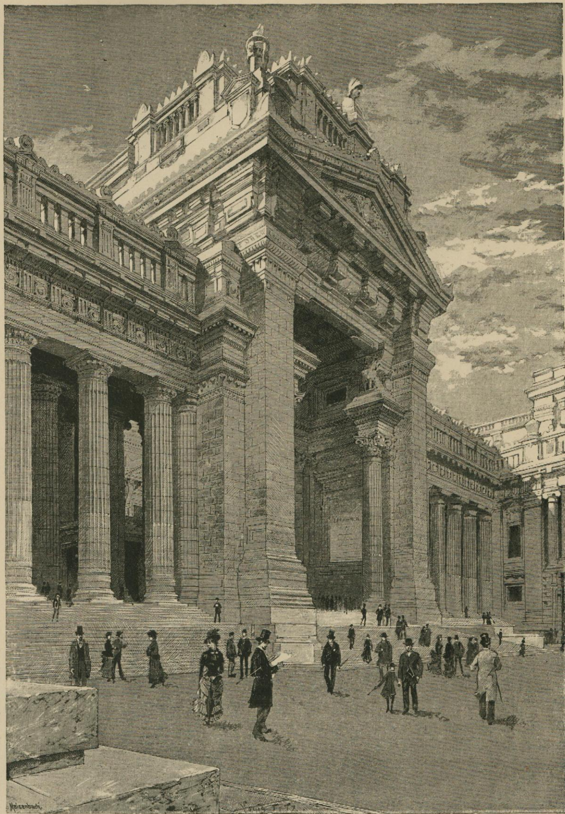
LE GRAND PORTIQUE D'ENTRÉE DU PALAIS DE JUSTICE. Dessin original de L. Titz.